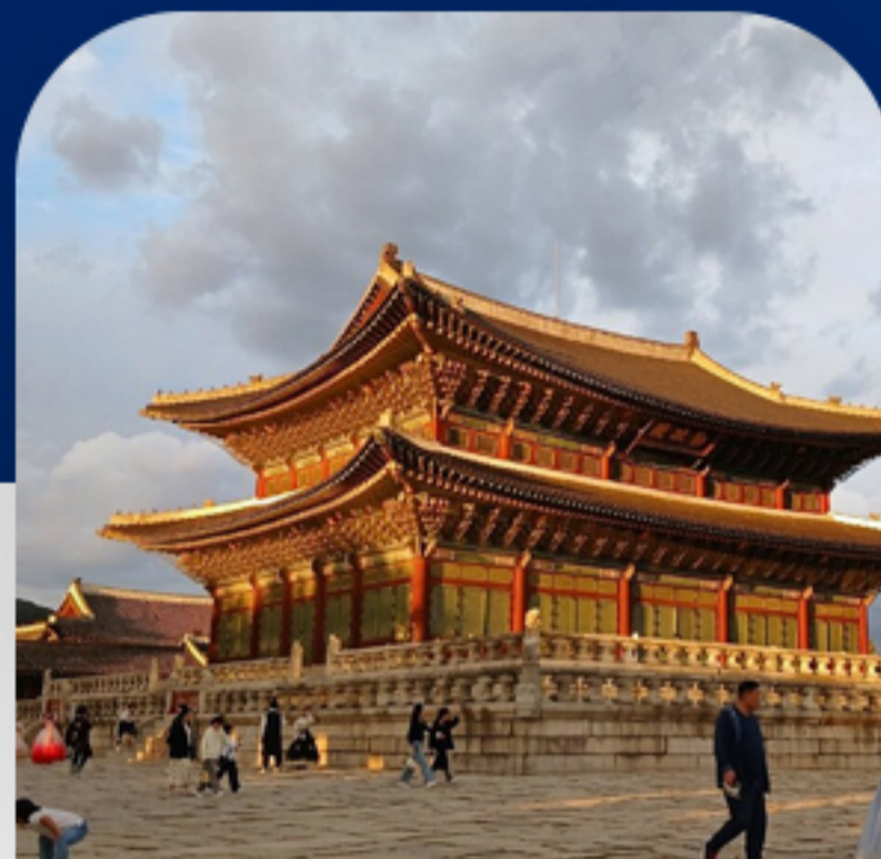
کاخ گیونگ بوک گونگ روز دوم