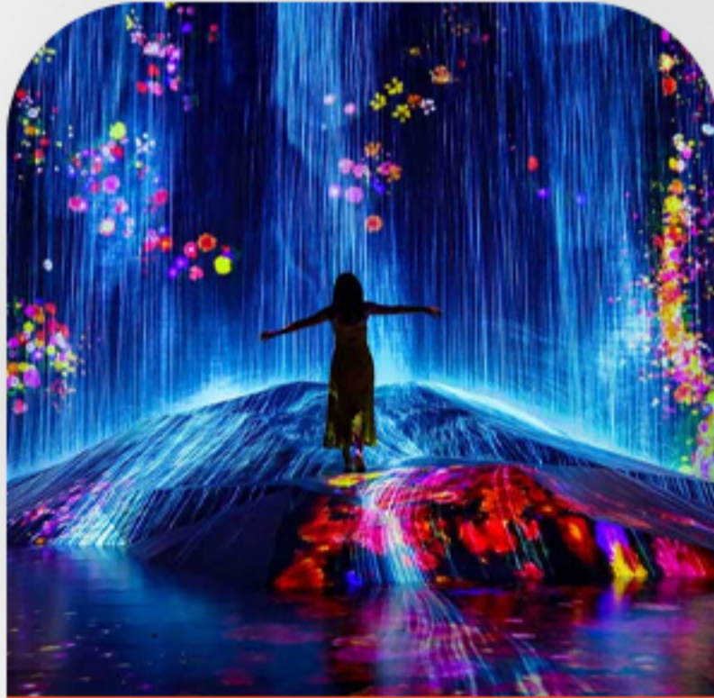
موزه هنر دیجیتال بوسان روز هفتم