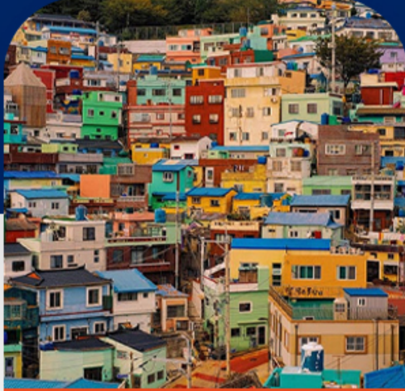
دهکده فرهنگی گم چئون روز ششم