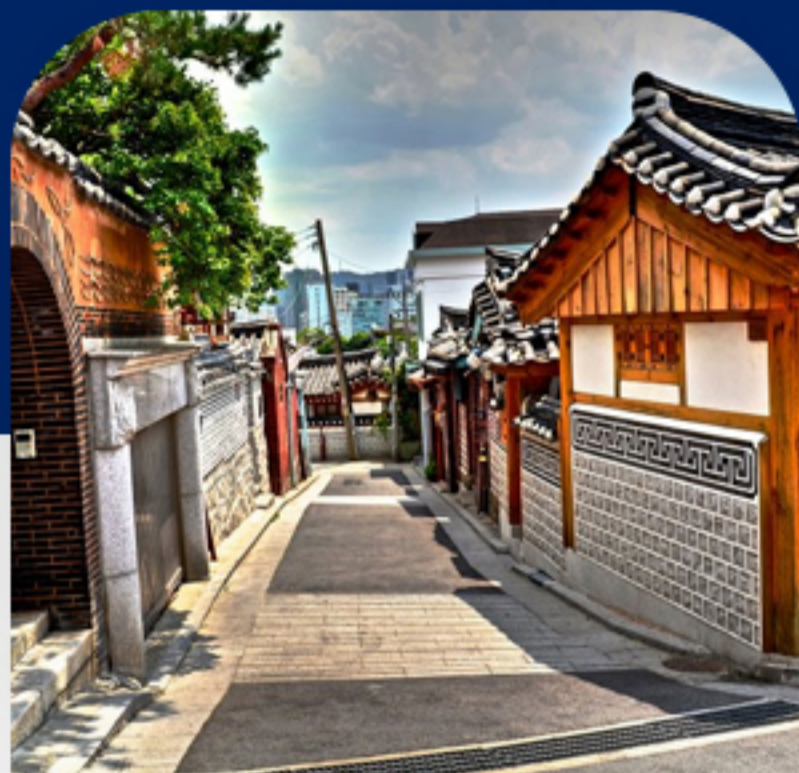
روستای بوکچون هانوک روز دوم