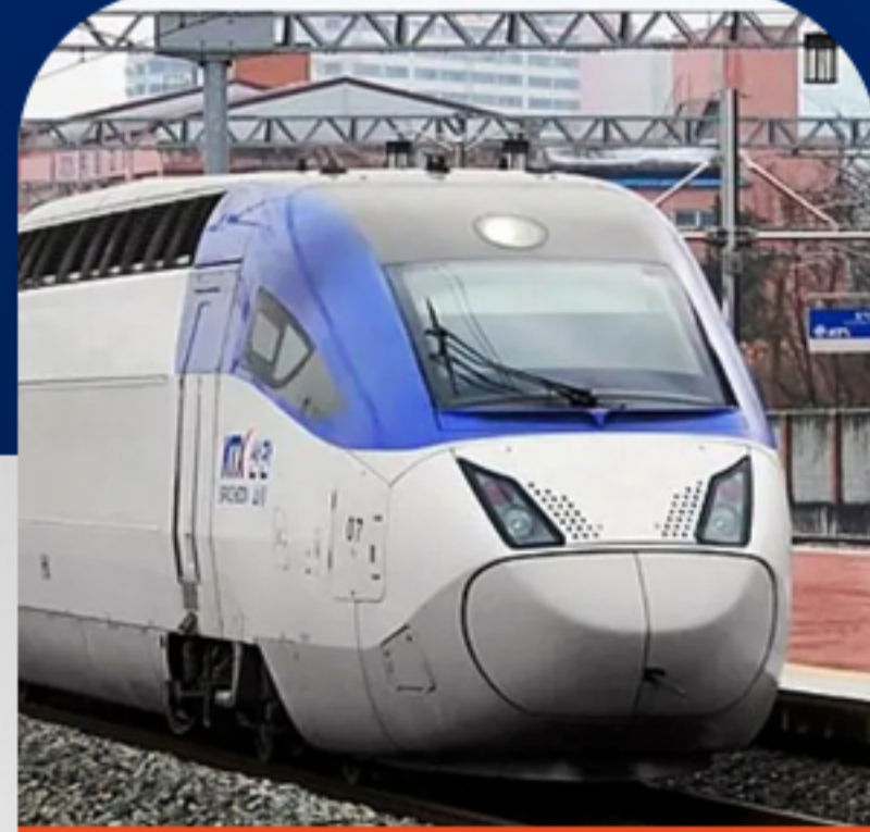
قطار سریع السیر KTX روز ششم