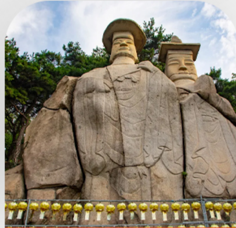
معبد هاندونگ یونگ وونگ روز هفتم