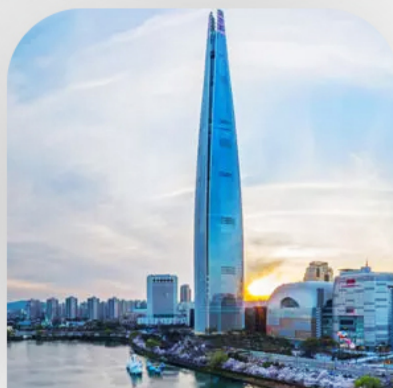
برج لوته سئول روز سوم