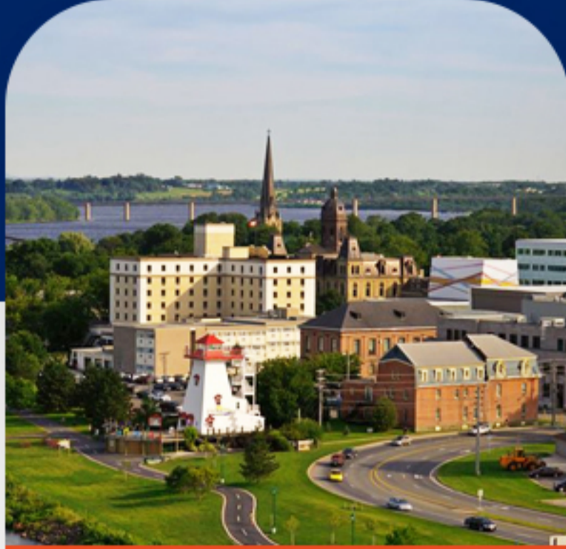
دانشگاه یورک ویل روز ششم