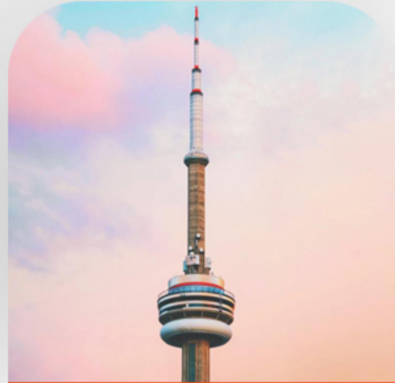
برج سی ان روز ششم