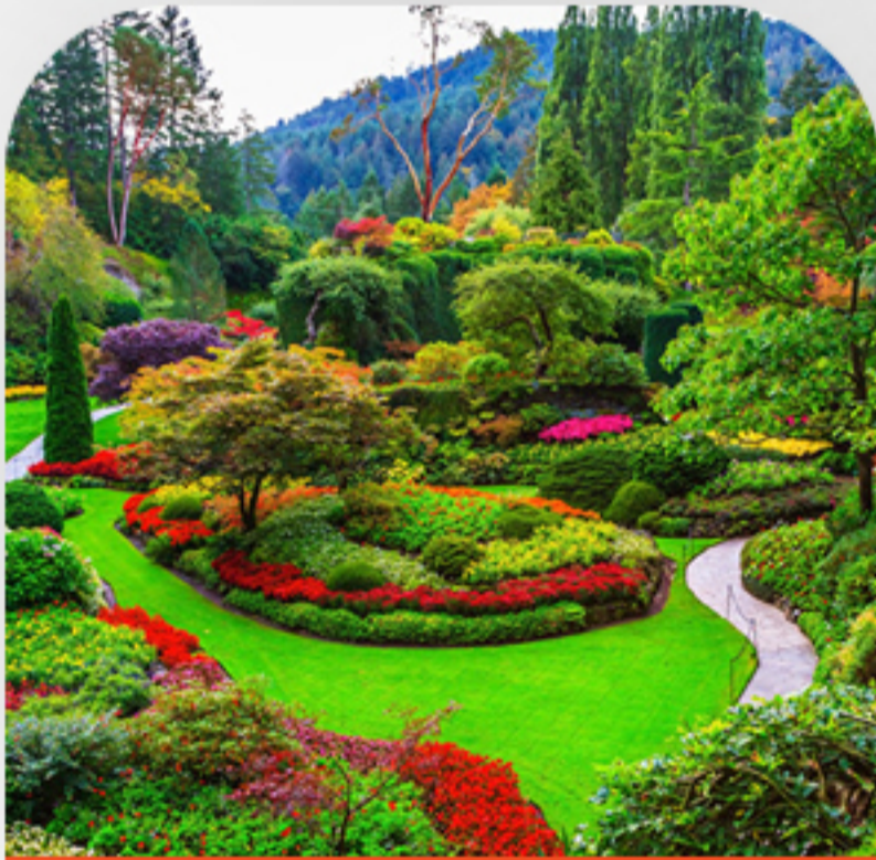
باغ بوچارت روز چهارم