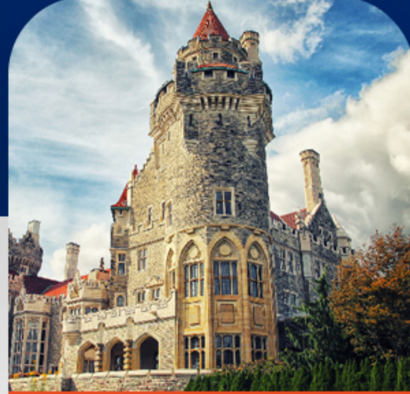
قصر باشکوه کاسالوما روز ششم