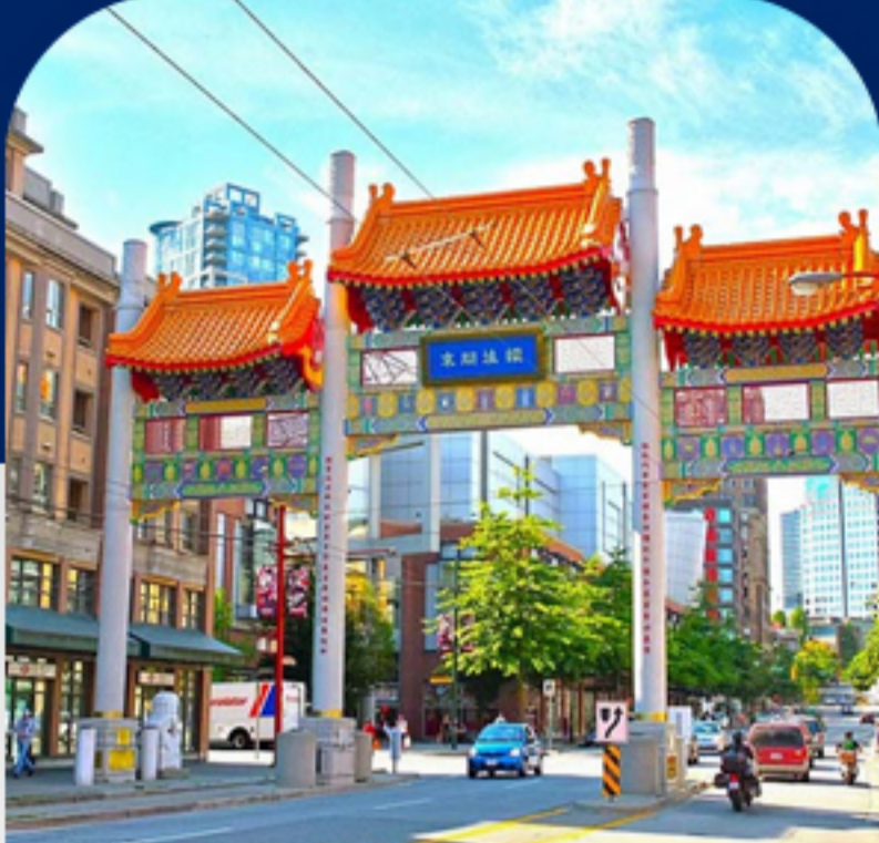
محله چینی‌ها روز دوم