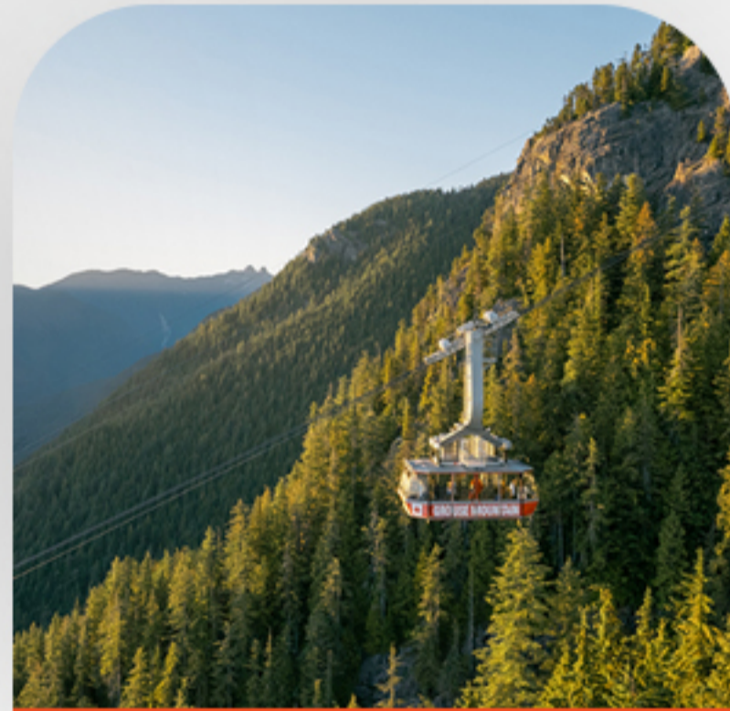
تپه گروس روز سوم