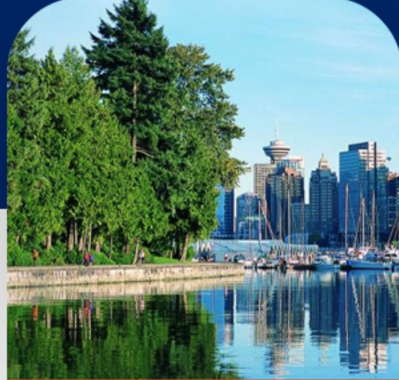
پارک استنلی روز دوم