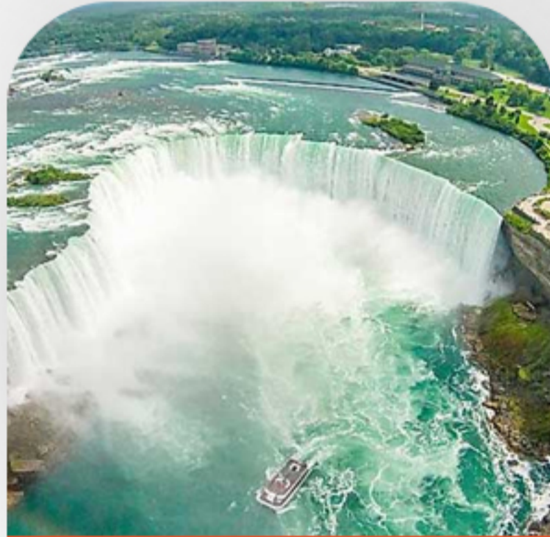
آبشار نیاگارا روز هشتم